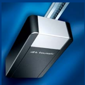
tousek Garagentorantriebe sparsam und schnell