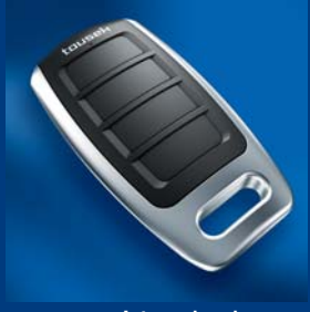
tousek Impulsgeberprogramm kompatibel und sicher