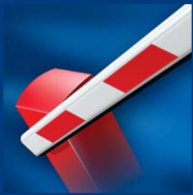
tousek Schrankensysteme formschön und robust