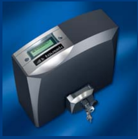
tousek Schiebetorantriebe kompakt und sicher

Ausführung, Zusammenstellung, technische Veränderungen sowie Satz- und Druckfehler vorbehalten. Alle Inhalte sind Urheberrechtlich geschützt. Nachdruck, digitale Vervielfältigung, auch auszugsweise, nur mit unserer schriftlichen Genehmigung.